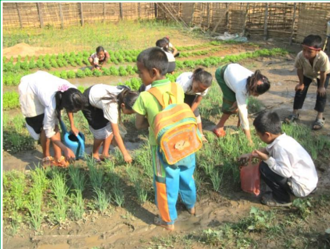
ການເຮັດສ່ວນຄົວຂອງນັກຮຽນ