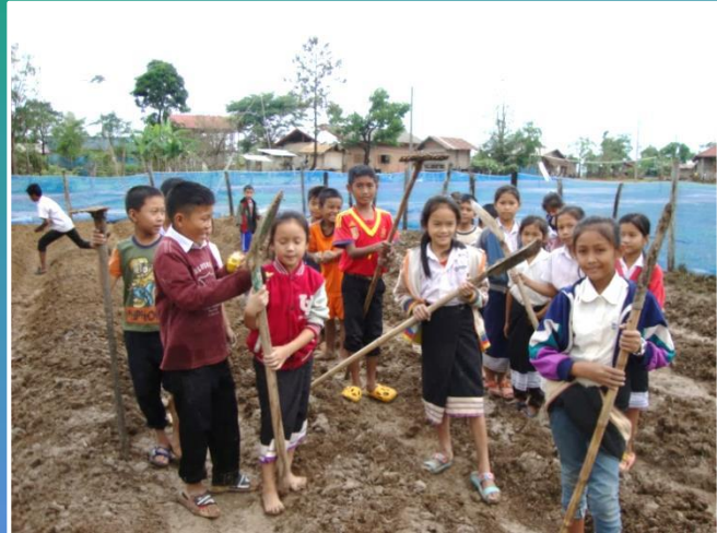
The students make school gardens